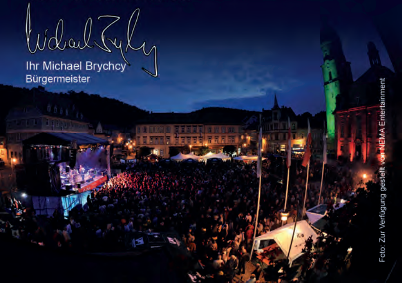
Ihr Michael Brychcy Bürgermeister

Lassen Sie uns zusammen ein großes und beschwingtes Fest feiern - ich freue mich auf Sie.